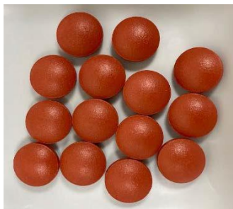
図1: ビタミンCコーティング錠の外観