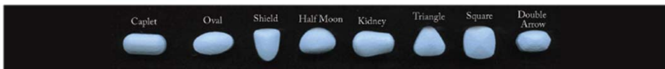
Figura 1: La forma del comprimido puede afectar la percepción de tamaño y mejorar la diferenciación y el recuerdo de este.