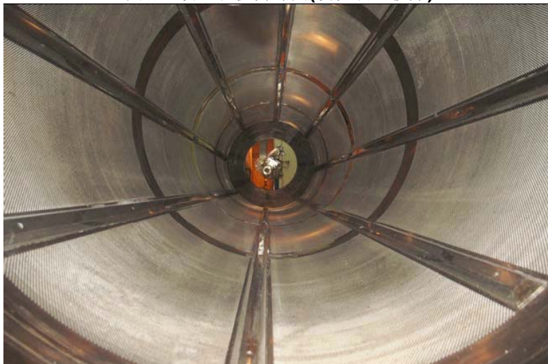
图2.连续包衣机内部图(喷枪装置移除)

以允许包衣锅有批处理和连续包衣两种操作模式；另一个改进是该包衣机内部没有挡板(见图2)，而是防滑门，片剂在锅内的移动完全是通过片剂的添加速度和包衣锅出片端的堰板高度来控制的。