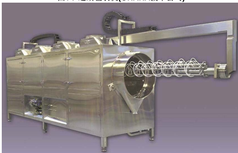
图1 . 连续包衣机(OHARA技术公司)

在连续包衣机出片的位置配备了气动控制堰板,当堰板放低时,包衣锅内可以容纳所有的包衣片,当抬高堰板时,可以控制包衣锅内片子流出的速度,这个控制装置以前的连续包衣锅有所改进,它可