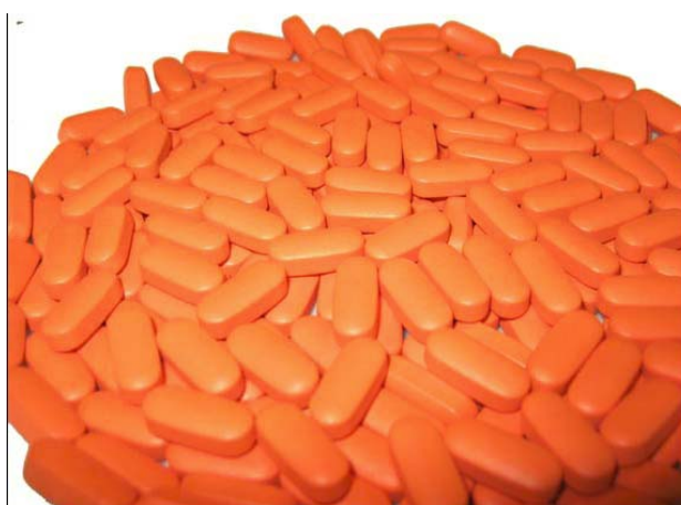
图3.连续包衣模式下从出片处取的包衣片

在这两种模式下(批处理模式或连续模式)，包衣所得片剂的外观都是好的，包衣片的颜色均匀，包衣片面没有任何的缺陷(图3)。