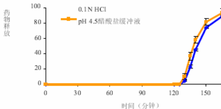
图3.处方2. 潘妥拉唑钠