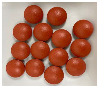
图 1: 薄膜包衣的维生素C片