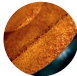
半连续化 包衣设备